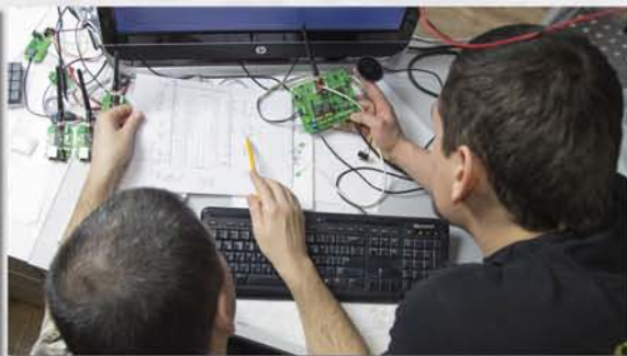
...над ними работают инженеры...