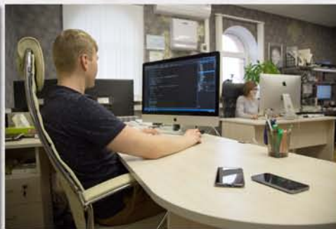
...программисты и дизайнеры...