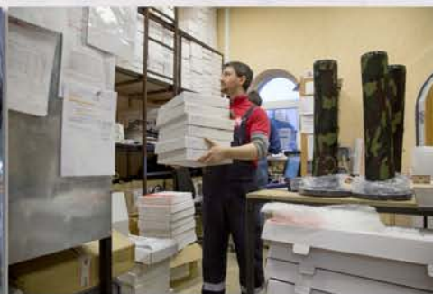
...попадают на склад готовой продукции...