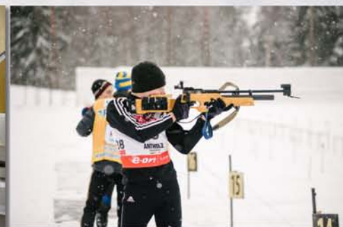
...вперед к победам!

ЗАКАЗАТЬ «ЛАЗЕРНЫЙ БИАТЛОН» ВЫ МОЖЕТЕ СВЯЗАВШИСЬ С НАМИ: