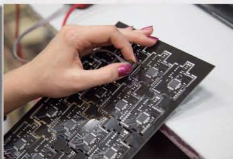
...проходят контроль качества...