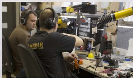
...участок крупносерийной сборки...