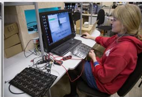
...и тщательную проверку...