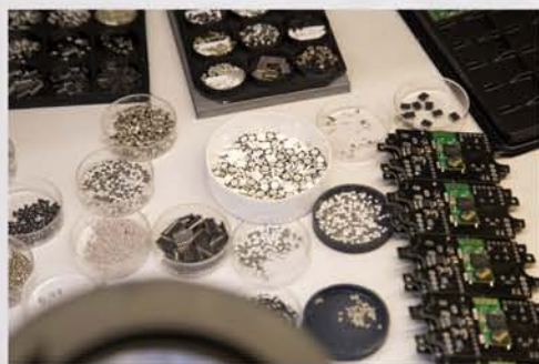
...самые надежные комплектующие...