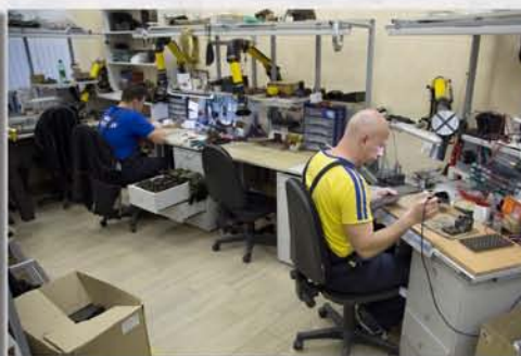
...поступают в монтажный цех...